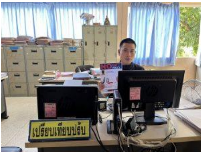
รูปถ่ายผลการดำเนินงานจริง ณ จุดบริการ ของสถานีตำรวจภูธรโพธิ์ตาก