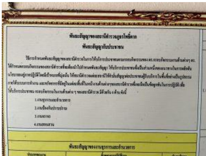
รูปถ่ายผลการดำเนินงานจริง ณ จุดบริการ ของสถานีตำรวจภูธรโพธิ์ตาก