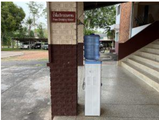
รูปถ่ายผลการดำเนินงานจริง ณ จุดบริการ ของสถานีตำรวจภูธรโพธิ์ตาก