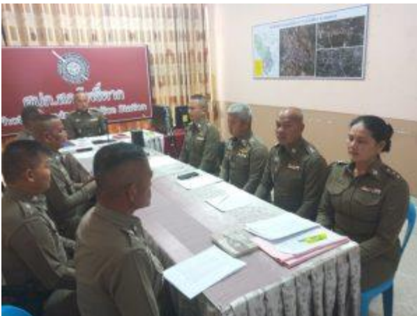
รูปถ่ายผลการดำเนินงานจริง ณ จุดบริการ ของสถานีตำรวจภูธรโพธิ์ตาก