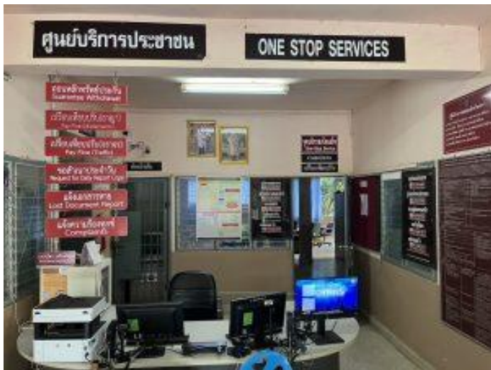
รูปถ่ายผลการดำเนินงานจริง ณ จุดบริการ ของสถานีตำรวจภูธรโพธิ์ตาก